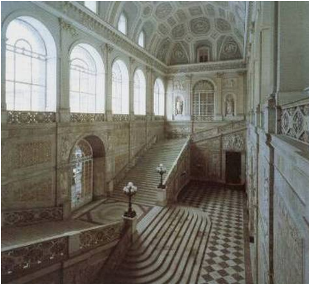
Palazzo Reale, scalone d'onore (Napoli)